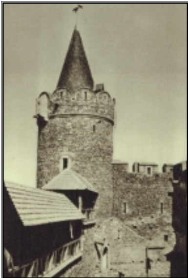
Zamek Grodziec.