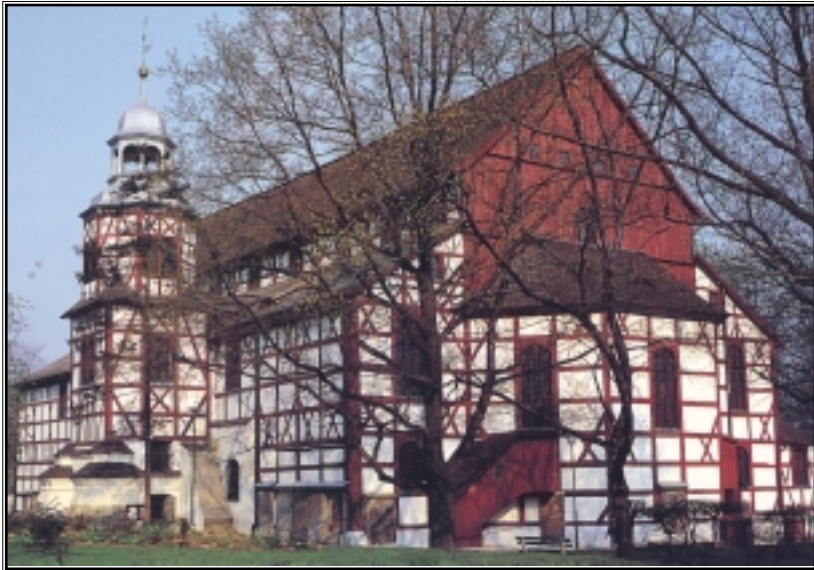
Kościół Pokoju w Jaworze.